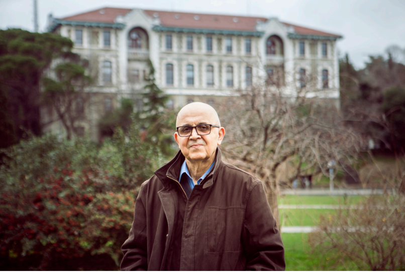
Boğaziçi Üniversitesi'nde Beşerî Bilimler, Tarih bölümleri ardından Atatürk Enstitüsü yılları 1977- 2022.

Ben tarihi her zaman sosyal ve beşerî bilimlerin tepe noktasında disiplinler arası bir uğraş olarak gördüm ve çalışmalarım o doğrultuda oldu. Geride elli yılı aşkın bir birikim bıraktım. Türkiye'de tarih bilimine katkıda bulunduysam ne mutlu bana...