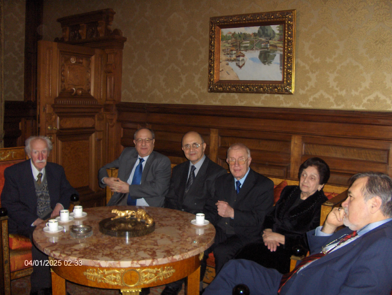
Moskova günleri... Rus Türkologlar ve Mülkiye sınıf arkadaşım İlber Ortaylı ile...