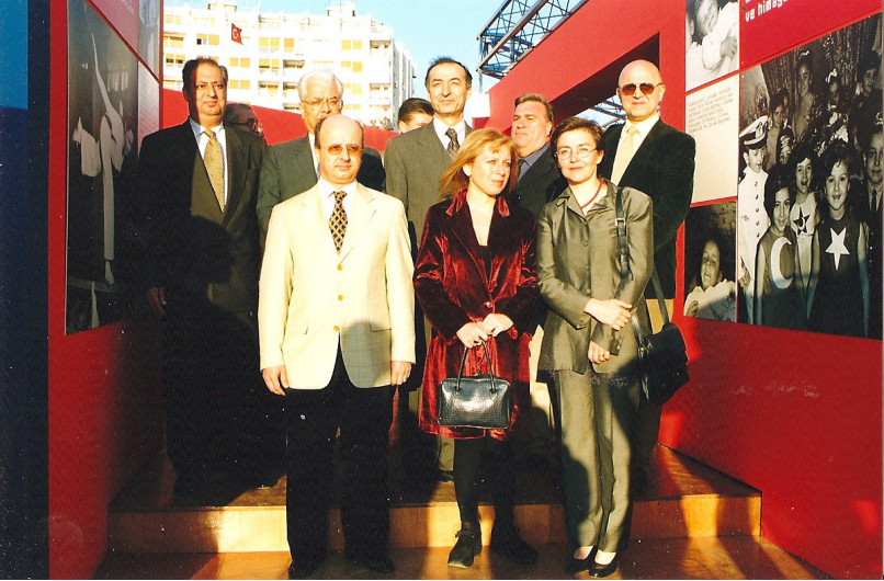
Yapı Kredi Bankası'nın küratörü olarak Cumhuriyet'in 75. Yılı sergilerinin İzmir ayağında açtığımız sergi... Vali Bey'e açıklamada bulunurken...