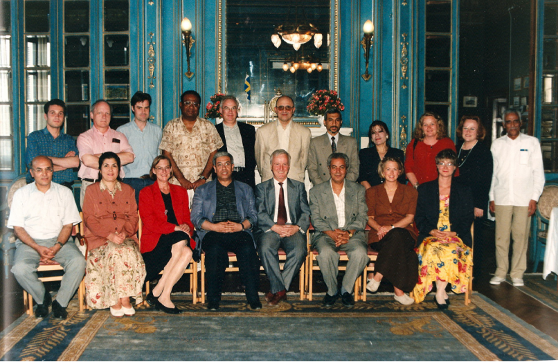
Hollandalı meslektaşlarla bir çalıştay sonrası Hollanda sarayında (Beyoğlu)...