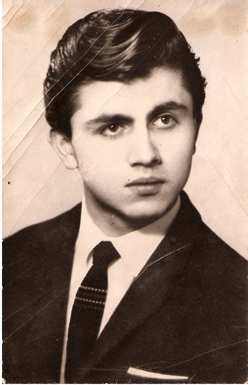
Fatih'in Çarşamba semtinden Saint-Joseph Lisesi'ne... İki hazırlık, üç orta, üç lise... 1957-1965. Lise son sınıf öğrencisi Zafer Toprak

Zafer Toprak: Tabii Spartan bir eğitim anlayışı... İki yıl hazırlık, üç orta, üç lise, toplam sekiz yıl geçirdim Saint-Joseph 'te. İlk dört yıl yatılıyım. Çarşamba'dan nehâri olarak gidip gelinmiyor. Orta üçe geçince annem emekli oldu. Emlak Kredi Bankası'ndan da kredi alarak Kadıköy'de Bahariye Kuzu Kestanesi Sokak'ta bir daire aldık ve ben son dört yılımda nehâri oldum.