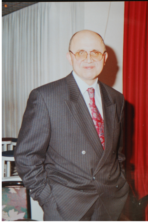
Boğaziçi Üniversitesi'nde Beşeri Bilimler, Tarih bölümleri ardından Atatürk Enstitüsü yılları 1977- 2022.