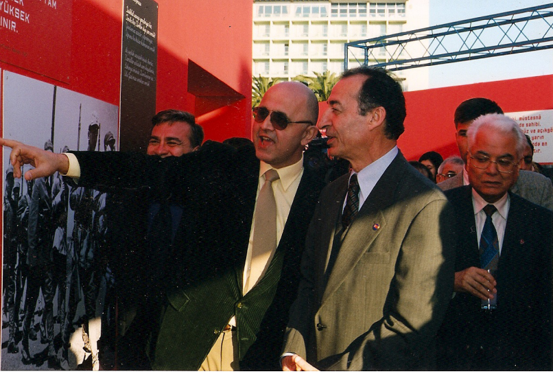
Yapı Kredi Bankası'nın küratörü olarak Cumhuriyet'in 75. Yılı sergilerinin İzmir ayağında açtığımız sergi... Vali Bey'e açıklamada bulunurken...