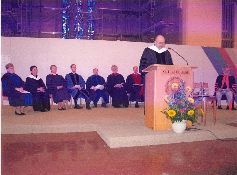
Uzun yıllar Orta Doğu programlarını yönettiğim Saint Olaf Üniversitesi'nden (Minnesota) fahri doktora aldığım gün...