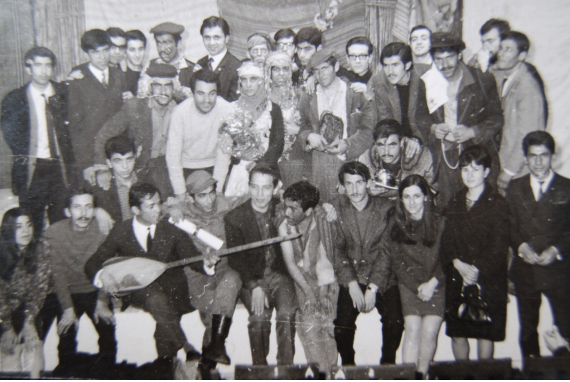
Mülkiye yılları 1965-1969... SBF Tiyatro Kulübü'nde rejisörlük ve oyunculuk yılları...