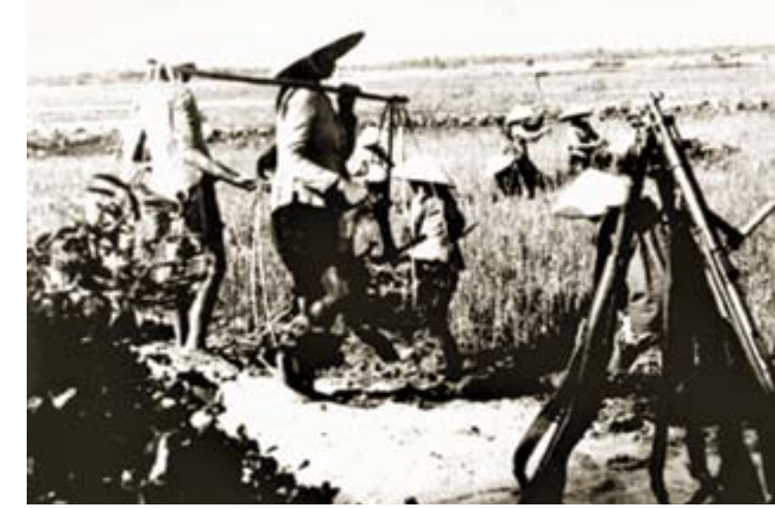
'17. Paralel' film çekiminden bir görüntü

kişilerle karşılaştı. Kimiyle yakın dost, kimiyle yakın çalışma arkadaşı oldu. Bazılarıyla ise zaman içinde yolları ayrıldı. 20. yy.ın hemen bütün büyük olaylarını, alt-üst oluşlarını kamerasıyla belgeledi. Büyük umutlara, başarılarla olduğu kadar hayal kırıklıklarına, güzelliklerin yitip gitmesine de tanıklık etti. Otobiyografisinden kendi deyişleriyle; "Eğer Uçan Hollandalı 1917'deki Leningrad'ı bilmiş olsaydı ve şimdi oraya tekrar geri dönsey-