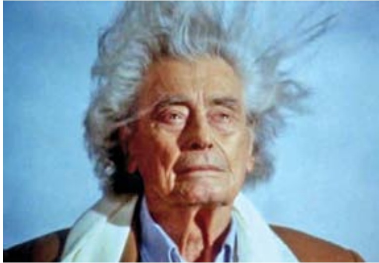
Ivens, 'Rüzgârın Hikâyesi' 1988

1989'da, Çinde'ki Tiananmen Meydanı'ndaki olayları protesto için katıldığı bir gösteri sonucunda rahatsızlanarak kaldırıldığı hastanede bir hafta sonra, 28 Haziran'da ölmesiyle son bulur.