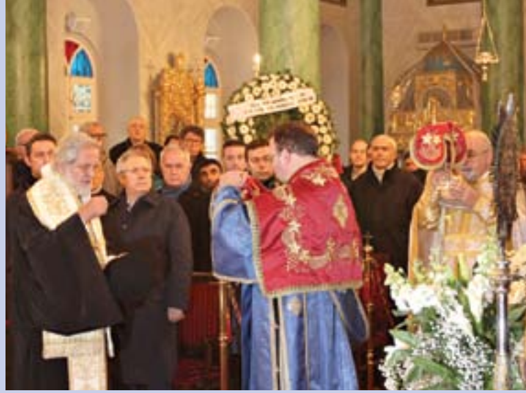
Aya Dimitri Kilisesi'ndeki Lefter için yapılan dini tören