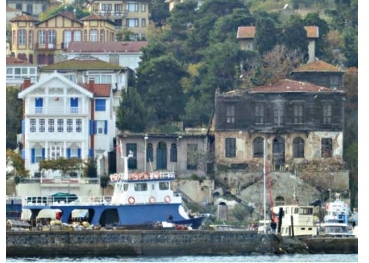
Ortadaki evin yangından sonraki görünümü (2013)

onurlu diye düşündü herhalde. İlk yıllarım, taze bir gelin gibi süzülüğüm günler gözümün önünden film şeridi gibi geçiyor. Herkes parmak ısırır, seyretmeye doyamazdı. Kimler misafir olmadı ki odalarımında. Dönemin en asil, en saygın devlet adamları, din adamları, sanatçılar, hariciyeciler. Komşularımınla birlikte bir dönem otel görevi bile yaptım. Bendeniz Royal Otel, esmer komşumsa Bristol. O günlerde Bristol tarafında, Heybeliada İlkokulu'na sığmayan minik öğrenciler, şu anda külleri havada uçuşan ahşaplarımızı soluyarak rahle-i tedristen geçtiler. Bizim yaşlılığımız bile güzeldi, inanılmazdı. Dergilere defalarca kapak oldum. Ansiklopedilerde Heybeliada'yı temsil ettim. Bazen tek başıma, bazen komşularımınla. İtfaiyeciler önümüzdeki yola iyice yerleştiler, borular takıldı, sular artık bana da geliyor ama yeterli olamıyor. Biliyor musunuz, kapımızın önündeki o yol yıllar önce yoktu, deniz vardı. O zarif merdivenlerimin ortasındaki kapı aslında kayıkhanemin kapısıdır. Şimdi anlamsız bir bodrum halini aldı. O sevimli eşeklerin adamızı terk etmesinden sonra, artık önümüzde atlar, arabalar bekliyor. Alışık olmayanlar, atların o kokusu-