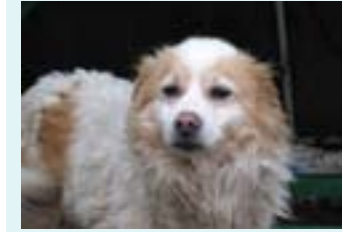
Melek Rus Finosu 8 yaş dişi kısır evde rahatlıkla olabilir, bir kere verdik geri geldi, barınakta açıkta geziyor.

İkisi de 1 yaş civarı kısır, golden tasma ve komut eğitilmiş, bulldog tasma tanımayan ama kolayca alışır gibi.