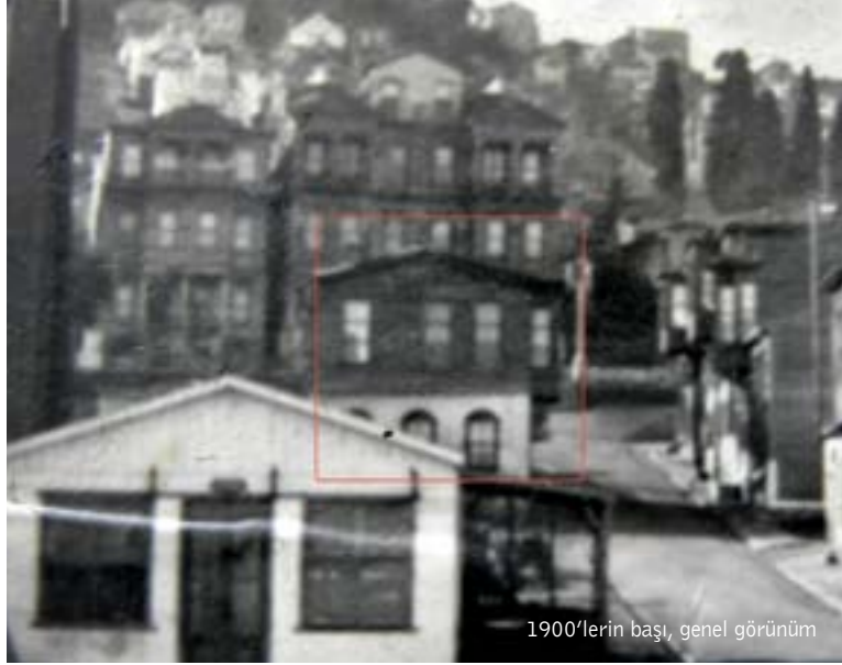
1900'lerin başı, genel görünüm