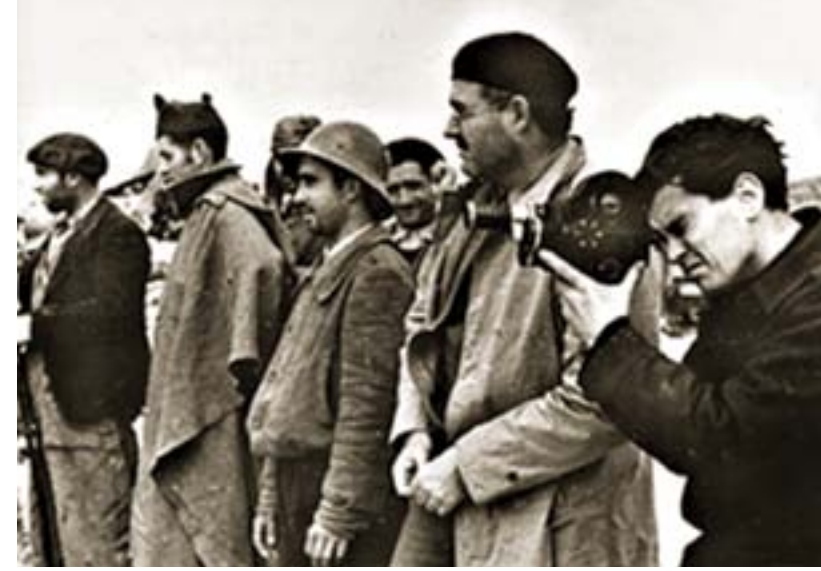
Hemingway ile birlikte 'İspanyol Toprağı' çekiminde

gibi küçük akımlardan bağımsız olarak üzerinde ileri doğru hareket ettiği ana akımdır. Hâlâ daha iyiye yöneldiğine inandığım bir akım. (...) Yeni bir sosyalizm için yeniden başlamalıyız ve yolumuza