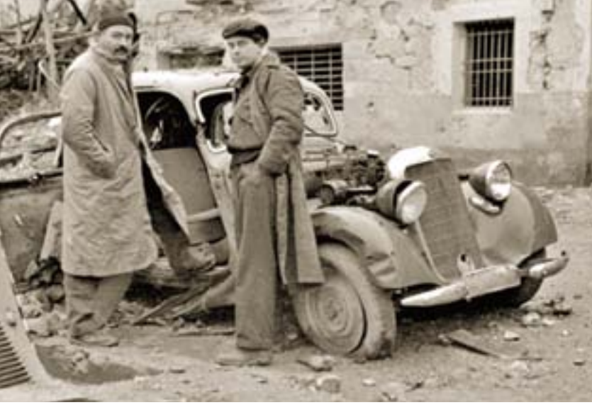
Madrid cephesinde Hemingway ile birlikte 'İspanyol Toprağı'

"Uçan Hollandalı" diye de anılan Joris Ivens, 1898 yılında Hollanda'nın Nijmegen şehrinde doğdu. Varlıklı bir orta sınıf aileden gelen Ivens, babasının fotoğraf malzemeleri satan dükkânlar zincirini devralmak amacıyla Rotterdam'da ekonomi, Berlin'de fotoğrafçılık üzerine tahsil gördü. Berlin'de bulunduğu 1920'li yılların başında avangart sanat akımlarının yanı sıra döneminin sokak çatışmalarına dönüşmüş siyasal akımlarından da etkilendi.