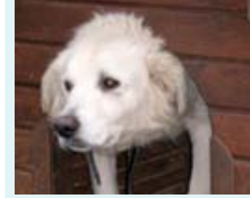
Kuzu 1 ve 2 İki beyaz labrador kardeş, dişi kısır 2 yaşındalar, hiç ayrılmadılar, birlikte sahiplendirmek istiyoruz, evde değil bahçe için uygunlar

sponsorumuz Barınak Gönüllüleri Derneği'ne, Adalar Belediyesi'nin veteriner hekimleri Volkan Altun ve Orkun Tanrıkulu'na, ekmek ve ilaç desteği veren Kadıköy Belediyesi Veteriner İşleri Müdürlüğü'ne, tüm şikâyetlere rağmen 5199 no'lu yasayı uygulayan Adalar Belediyesi'ne, gıda yardımı yapan tüm kişi ve kurumlara ve de sokaktaki canlarımıza sahip çıkan Adalı dostlarımıza teşekkür ediyoruz. Özel teşekkür ise barınaktan 6 köpeğimizi sahiplenen Ömer