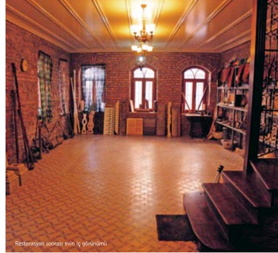
Restorasyon sonrası evin iç görünümü

uygulanıyor. Ahşap kısımları için emprenye edilmiş, en az 3-4 sene dinlendirilmiş Sibiryca camı kullanılıyor. Özenle biçilip kesilen yerlerine fırça ile emprenye malzeme sürülmek suretiyle hiçbir açık yüzey bırakılmıyor. İç ve dış doğramalarda (pencere ve kapılar) İsveç camı tercih ediliyor. Özenle çekilmiş pencere profilleri usta marangozların ellerinde yeniden hayat buluyor ve bu da evin güzelliğine güzellik